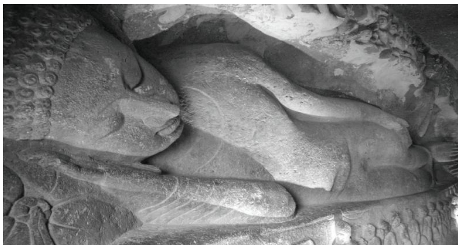
※此照片攝於印度阿江達石窟。(2009.10)