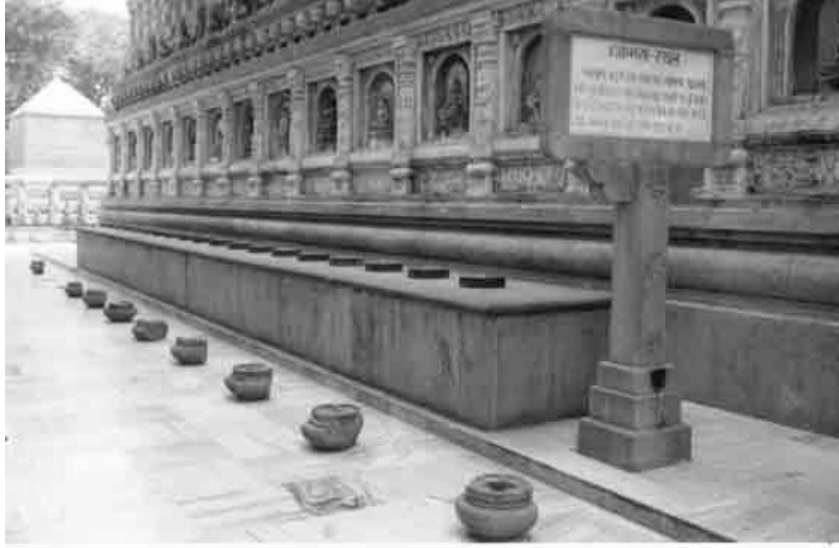
※此照片攝於印度菩提迦耶